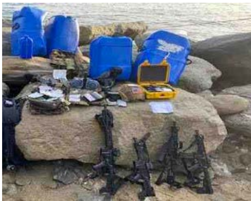
Parte del arsenal de armas incautadas al grupo de mercenarios que intentó desembarcar en la localidad de Macuto, estado La Guaira.

En la madrugada del 3 de mayo fue frustrada una incursión mercenaria en las costas de Macuto, en el estado La Guaira 27 . El ministro de Interior, Justicia y Paz de Venezuela, Néstor Reverol, informó que la FANB junto con las Fuerzas de Acciones Especiales (FAES) de la Policía Nacional Bolivariana (PNB) contrarrestaron una invasión por “vía marítima” en el litoral por parte de actores no estatales, denominada oficialmente “Operación Negro Primero”.